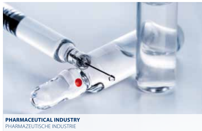
PHARMACEUTICAL INDUSTRY PHARMAZEUTISCHE INDUSTRIE

bpe-direct sind Rohre und Formteile von Dockweiler gemäß ASME BPE Spezifikation für den Transport flüssiger Medien in der Biotechnologie, der Kosmetik und in der pharmazeutischen Industrie.