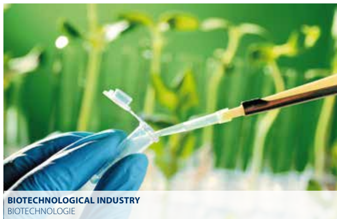
BIOTECHNOLOGICAL INDUSTRY BIOTECHNOLOGIE

bpe-direct is the Dockweiler tube and fitting program according to ASME BPE for the transport of liquid media in the biotechnology, cosmetic and pharmaceutical industry.